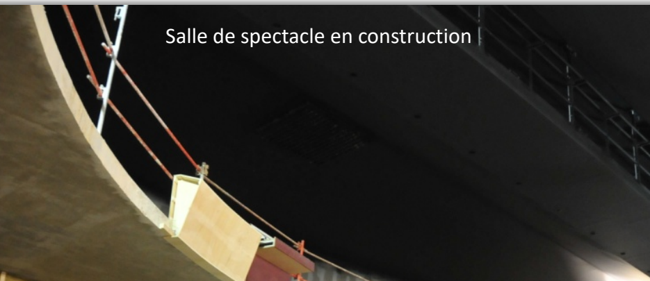
Salle de spectacle en construction

Depuis son ouverture, la gestion du théâtre est confiée à la SOTHEVY, une entreprise spécialisée dans la programmation et la gestion de salle de spectacles.