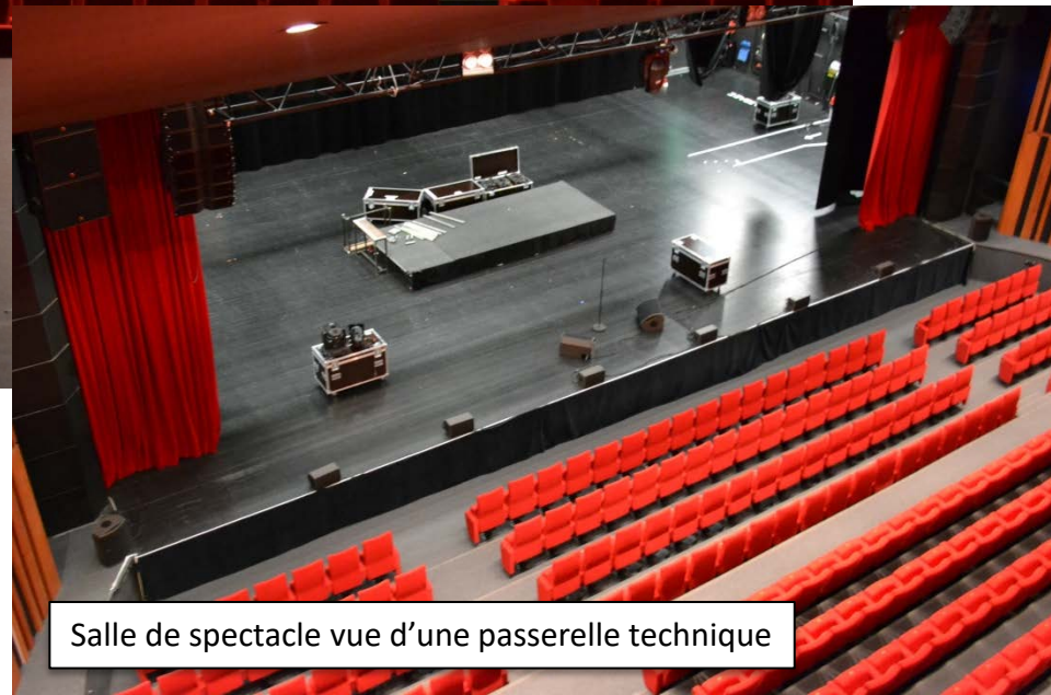
Salle de spectacle vue d'une passerelle technique

Le balcon : partie des sièges qui surplombent l'orchestre, offre une vue plongeante sur la scène.